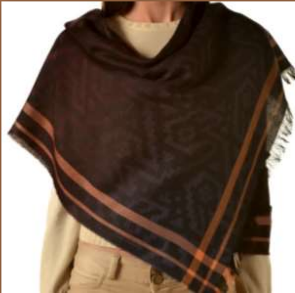
Chancay -5, Farbe XXC00020 70% Baby Alpaka, 30% Seide, 200 x 70 cm