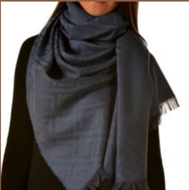
Chancay -3 Farbe XXC00030 70% Baby Alpaka, 30% Seide, 200 x 70 cm