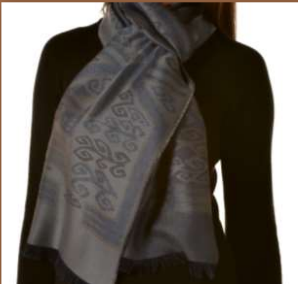
Nazca-1, Farbe XXC00040 70% Baby Alpaka, 30% Seide, 200 x 30 cm