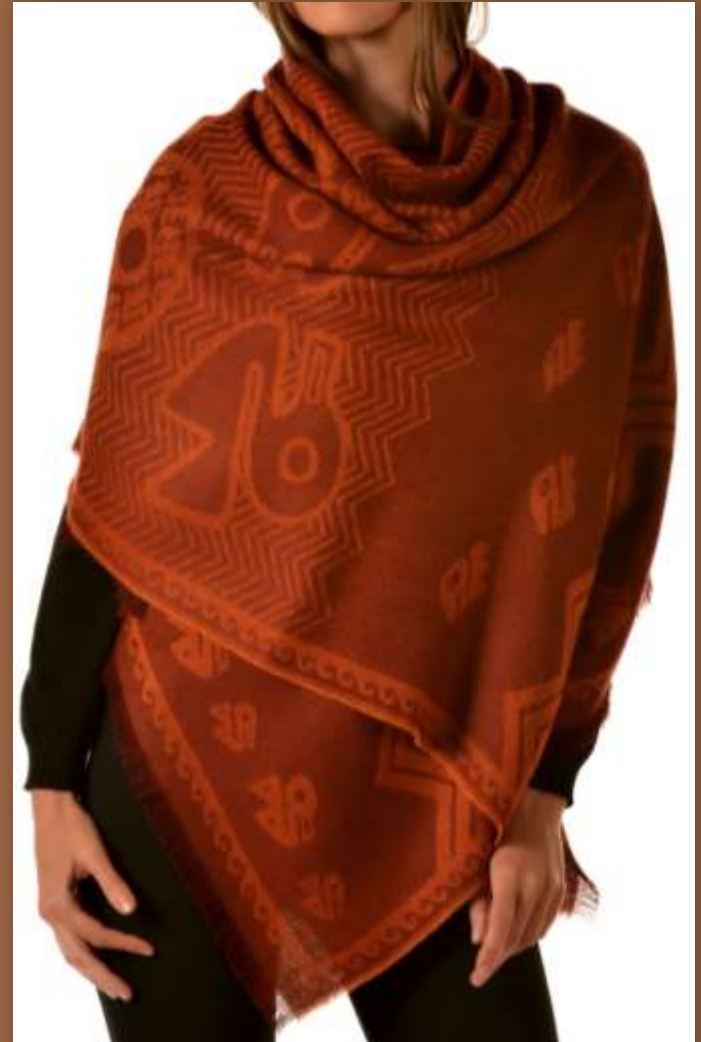
Chancay -2, Farbe XXC00040 100% Baby Alpaka, 200 x 70 cm