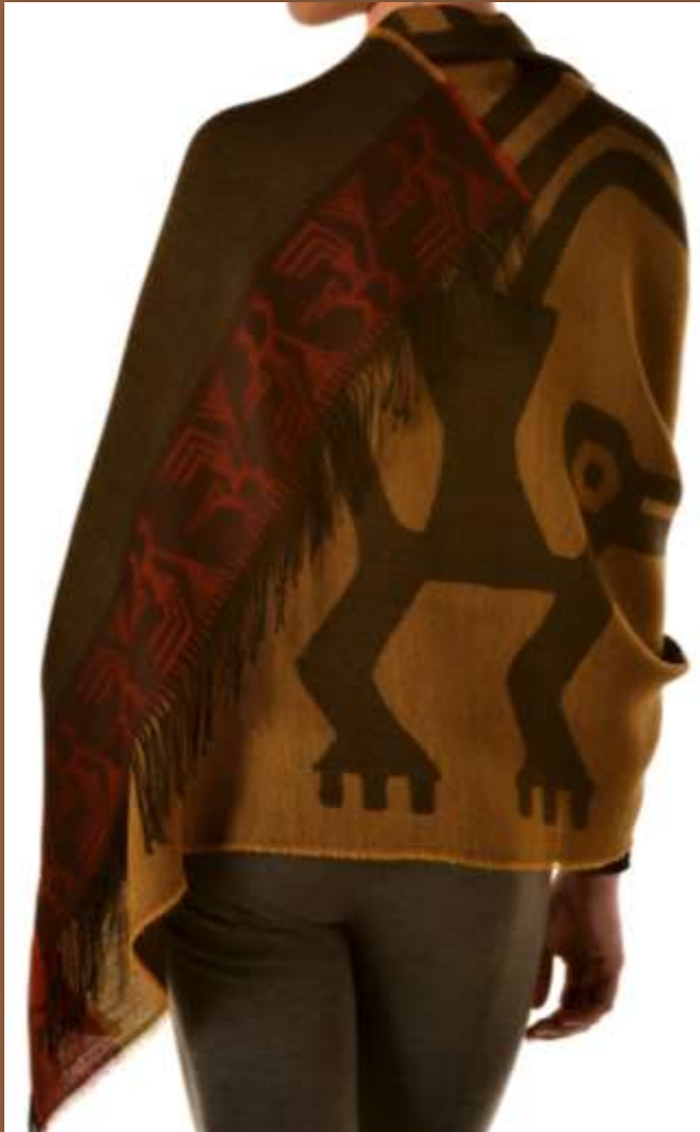
Chimú-1, Farbe XXC00020 100% Royal Alpaka, 200 x 75 cm