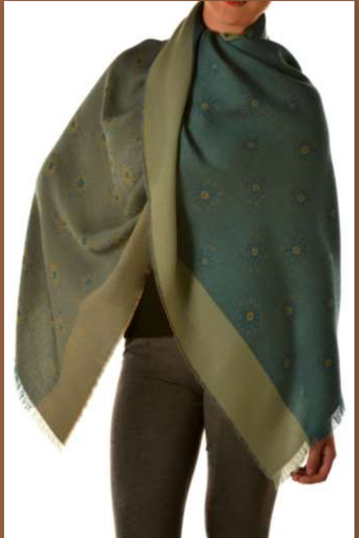
Paracas/Nazca-4, Farbe XXC00030 100% Baby Alpaka, 200 x 70 cm