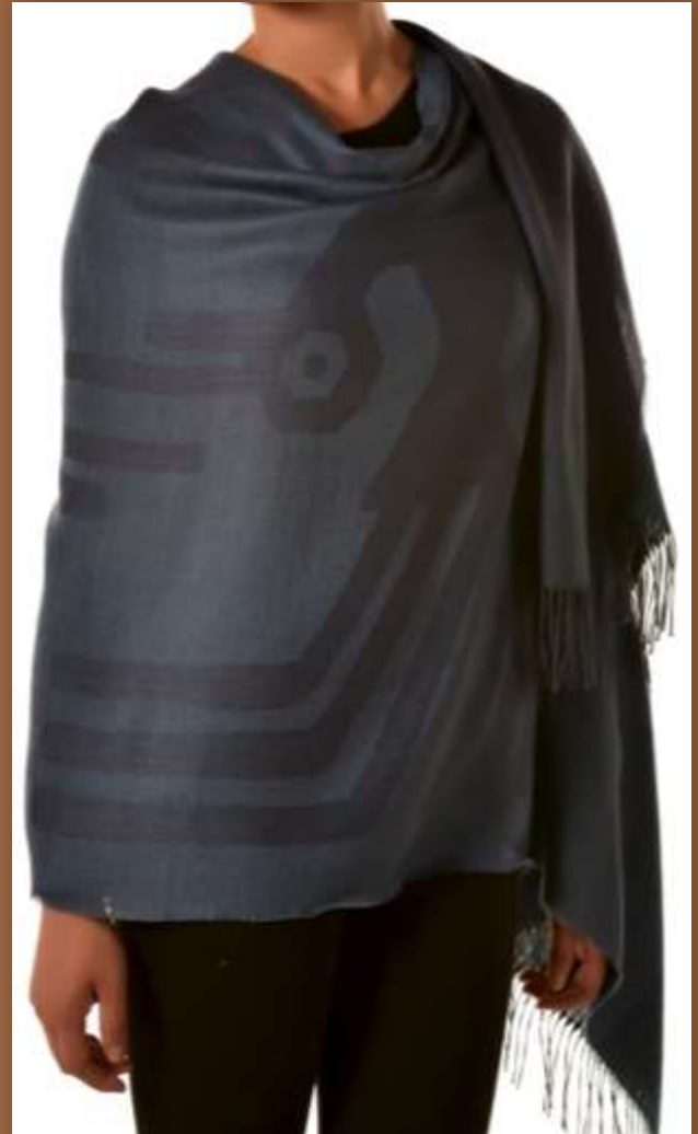
Chimú-1, Farbe XXC00030 100% Royal Alpaka, 200 x 75 cm