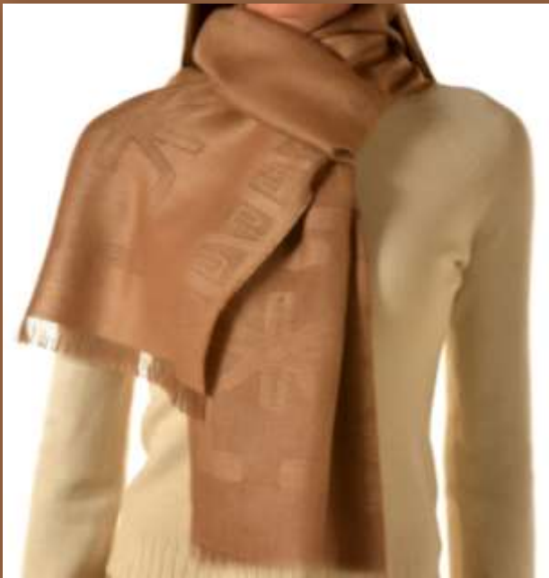
Nazca-2, Farbe XXC00020 70% Baby Alpaka, 30% Seide, 200 x 30 cm